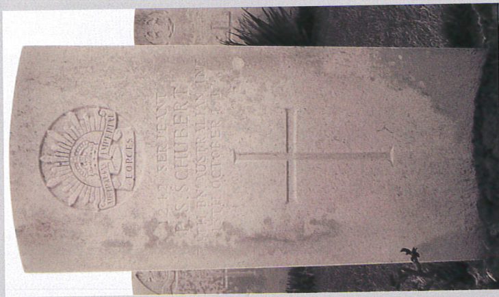
Graf 27/D/9 op Tyne Cot Cemetery (MMP)

tum in officiële bronnen is trouwens geen zeldzaamheid, gezien de soms complete chaos van de acties en de daaropvolgende reorganisatie. Ook de vindplaats van het lichaam van Schubert doet een verkeerde datum vermoeden. In maart 1920 werden zijn stoffelijke resten ontdekt op het huidige Tyne Cot Cemetery. Hij is slechts honderd meter verder begraven. De dood van Schubert werd thuis niet vergeten. Men zag zijn moeder op haar 90e verjaardag wenen toen Phillips naam genoemd werd. Dit gebeurde zo'n tweeënveertig jaar na zijn dood en zijn familie was altijd erg emotioneel wanneer het grote verlies van een zoon en broer besproken werd. 16 Ze kon het graf van haar zoon nooit bezoeken. De afstand was te groot en de reis te duur. Schuberts jongere broer die ook dienst wou nemen, gaf een van zijn zonen Phillip als tweede voornaam in nagedachtenis van zijn gesneuvelde broer. Terry Phillip Schubert werd op een dag na 43 jaar later geboren dan zijn gesneuvelde oom.